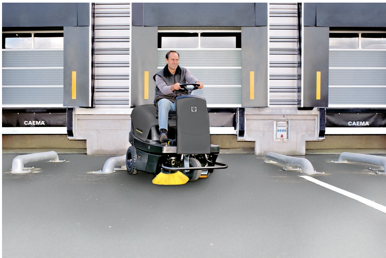
KM 100/100 R LPG

■ Система автоматической очистки фильтра