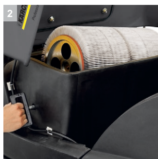
2 Фильтр большой площади с устройством автоматической очистки.