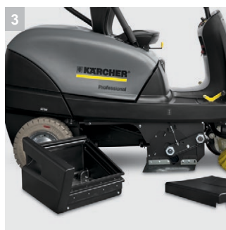
3 Простота обслуживания