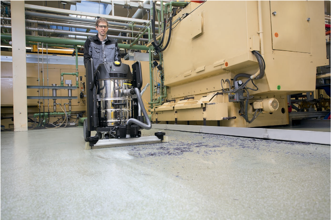
IVC 60/24-2 Tact 2