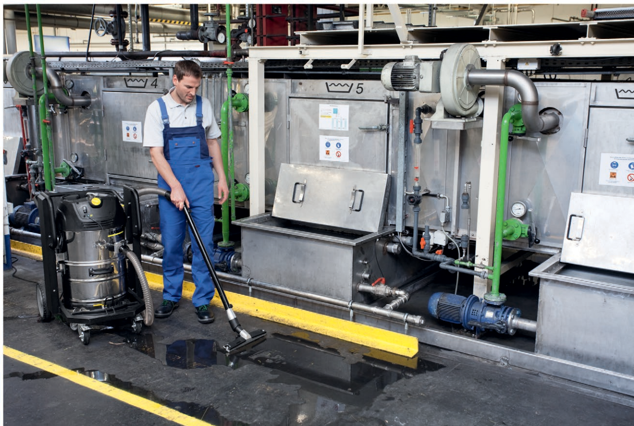
IVC 60/12-1 Tact EC